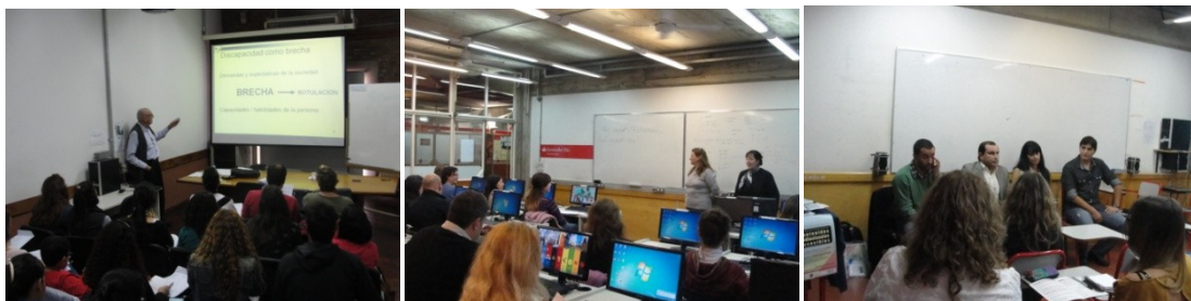
FOTOS: EXPOSITORES DE LAS JORNADAS DE CAPACITACION

Finalmente en septiembre se realizó la jornada de capacitación "Introducción a la accesibilidad en la Web" con expositores de la UTN. La capacitación tuvo por objetivo difundir los estándares y buenas prácticas que deben seguirse al construir sitios web para lograr que no tengan barreras que impidan su uso por personas con discapacidad. Que los sitios web cumplan con la accesibilidad es una necesidad para no excluir a algunos usuarios, especialmente a aquellos con discapacidad visual. Los sitios web accesibles además benefician a un conjunto mayor de usuarios, por ejemplo a quienes usan versiones antiguas o atípicas de hardware o software.